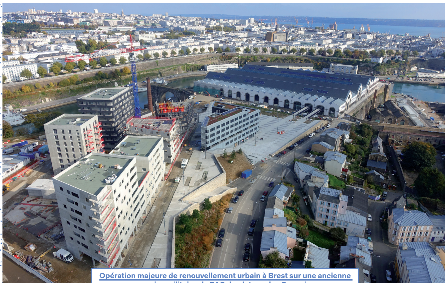
Opération majeure de renouvellement urbain à Brest sur une ancienne emprise militaire : la ZAC du plateau des Capucins

→ Calendrier de projet : Dès la fermeture définitive des ateliers en 2004, la collectivité mène les premières études afin de concevoir un plan guide de projet puis un réel projet d'aménagement. Le protocole de cession de terrain entre l'État et Brest Métropole océane a été signé en janvier 2009, avant que ne soit créée la ZAC, en