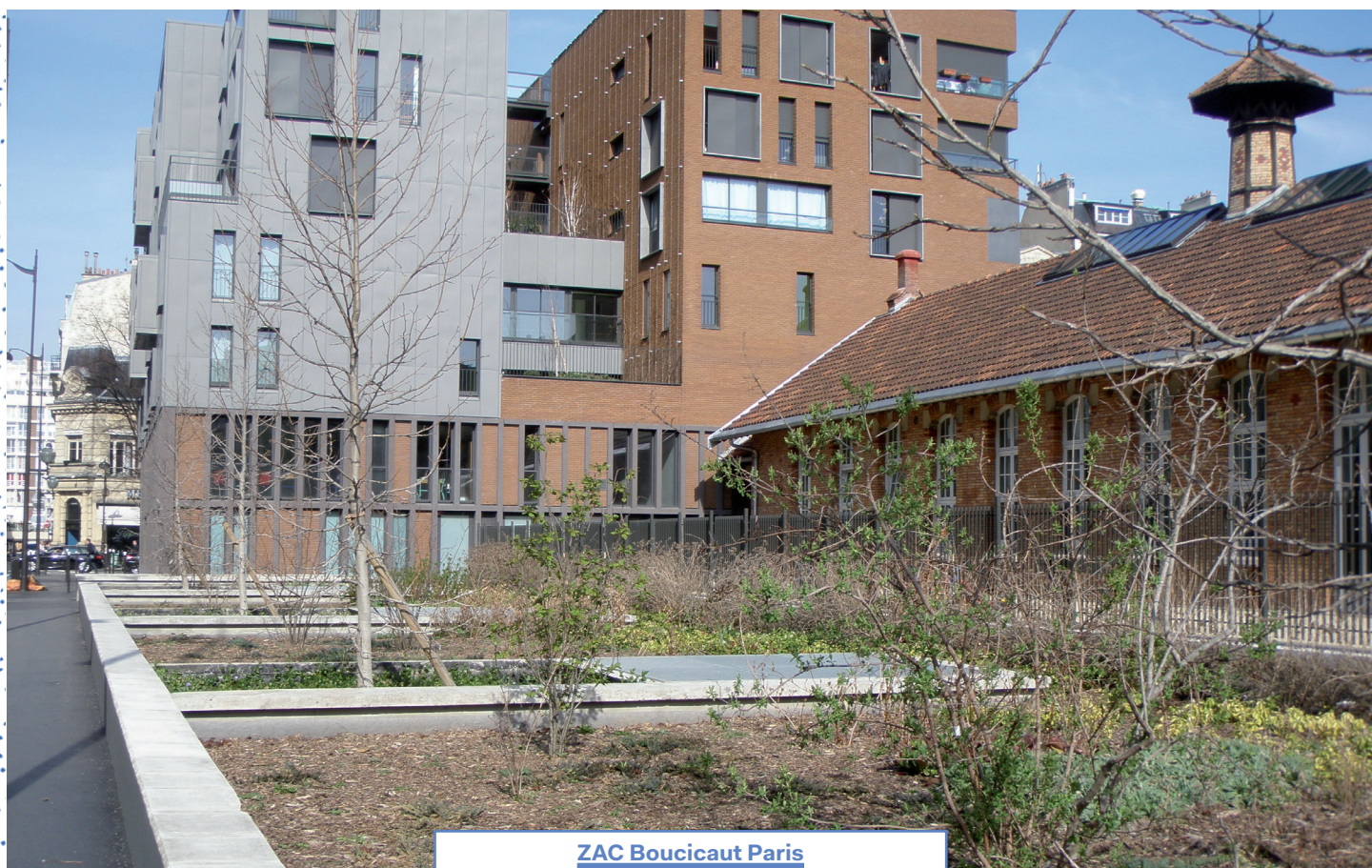
ZAC Boucicaut Paris