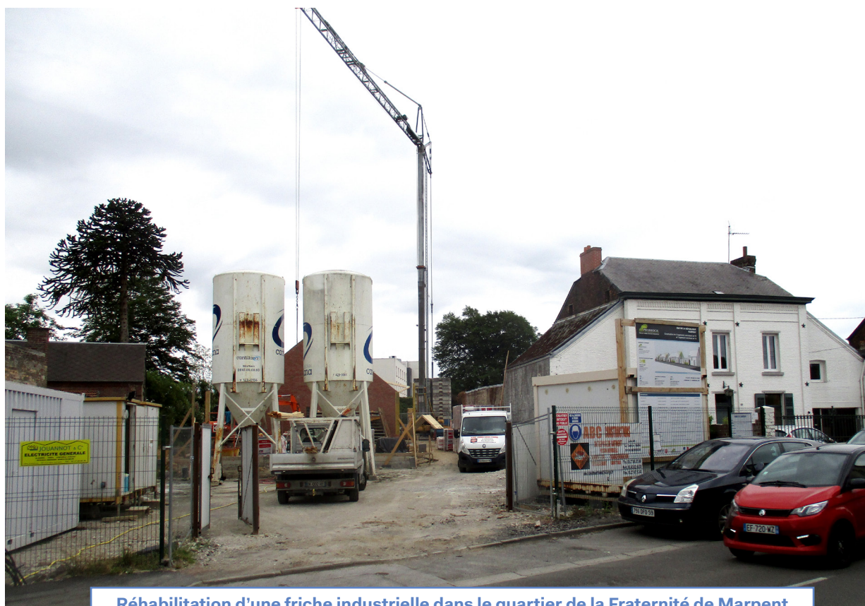
Réhabilitation d'une friche industrielle dans le quartier de la Fraternité de Marpent

→ Contexte : La commune, soucieuse de réhabiliter son centre-bourg, mobilise régulièrement plusieurs outils financiers et fiscaux pour mener à bien ses projets d'intérêt général.