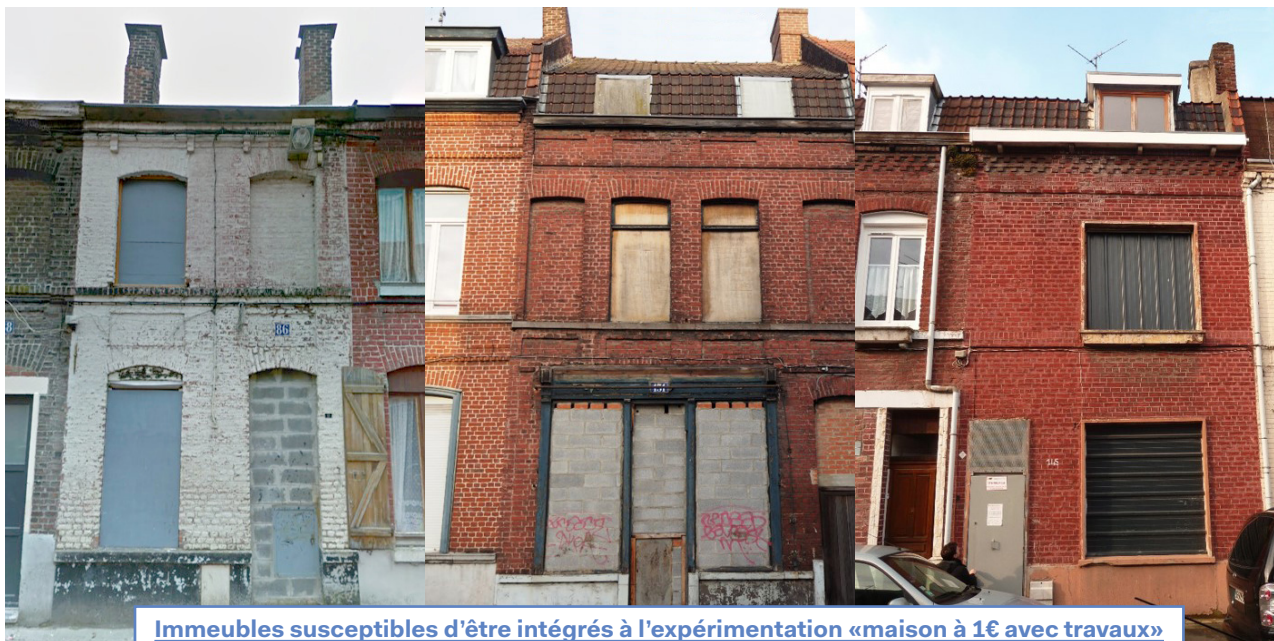
Immeubles susceptibles d'être intégrés à l'expérimentation «maison à 1€ avec travaux»

«Maison à 1€ avec travaux». La collectivité souhaite à terme, si l'expérimentation sur une vingtaine d'immeubles institutionnels est concluante, acheter des maisons actuellement inoccupées pour les mettre ensuite en vente au prix symbolique de 1 euro. Calqué sur la démarche similaire menée à Liverpool, ce projet vise à permettre à une partie de la population, aux revenus modestes, d'accéder à la propriété, tout en redynamisant la ville. Les travaux, à la charge des nouveaux propriétaires, atteindront des montants estimés à 80 000€ (une moyenne car ce montant évolue en fonction de l'état des biens et de leur surface).