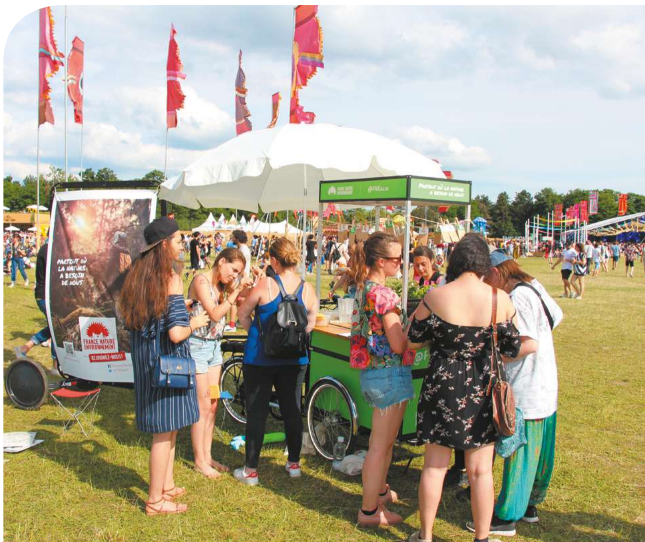
TOUTE L'ÉQUIPE DE FRANCE NATURE ENVIRONNEMENT REMERCIE CHALEUREUSEMENT SES DONATEURS ET DONATRICES.

Une partie des dons et libéralités a été affectée à nos actions d'information, de communication et plaidoyer. Contributions dans différentes commissions et instances nationales, campagnes de sensibilisation et de mobilisation, participation et organisation à des événements tous publics... : nous mettons tout en œuvre pour communiquer sur l'urgence de la transition écologique et faire connaître nos propositions. En 2018, notre contribution a notamment été très importante dans les débats autour des projets de lois sur les mobilités et l'alimentation. Dans un contexte économique et financier difficile pour la fédération, une autre partie des dons et libéralités a été affectée, conformément aux volontés des donateurs et donatrices, à la consolidation de notre modèle socio-économique par la diversification de nos financements et le développement de l'appel public à la générosité. Nous avons également affecté une partie des fonds collectés à nos frais de fonctionnement et nous avons pu faire évoluer notre plan stratégique, pour adapter nos objectifs de moyen et long termes à un contexte législatif, politique, économique et sociétal changeant.